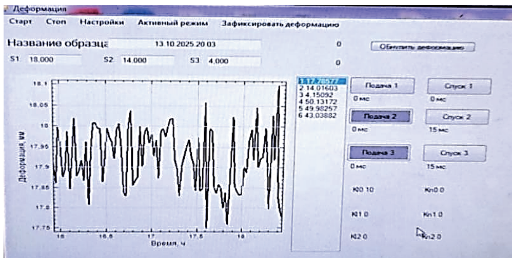
Рис. 3. Интерфейс ОСАКСПП Fig. 3. OSAKSPP interface