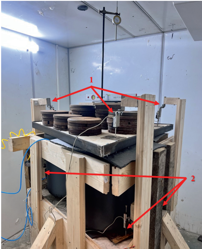
Рис. 2. Общий вид лотка: 1 – датчики перемещения фундаментной плиты (П1, П2, П3); 2 – датчики перемещения основания (О1, О2, О3) Fig. 2. General view of the tray: 1 – sensors for the movement of the foundation plate (P1, P2, P3); 2 – sensors for the movement of the base (O1, O2, O3)